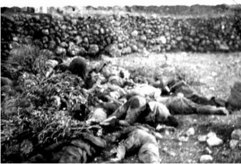
Nella foto scattata da un ufficiale ellenico il 22 settembre 1943, le salme di soldati italiani fucilati.