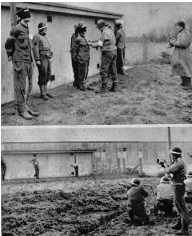
I caduti di Cefalonia