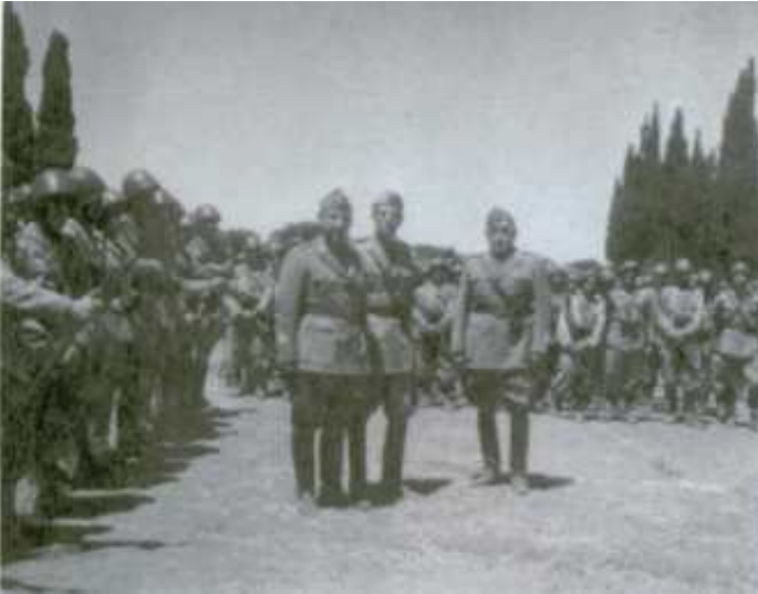
Cefalonia, ufficiali in attesa di esecuzione