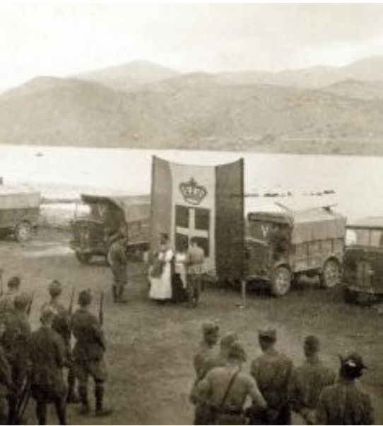
I giorni di Cefalonia e Corfù. La scelta della Divisione Acqui e la resistenza dei militari italiani al nazismo