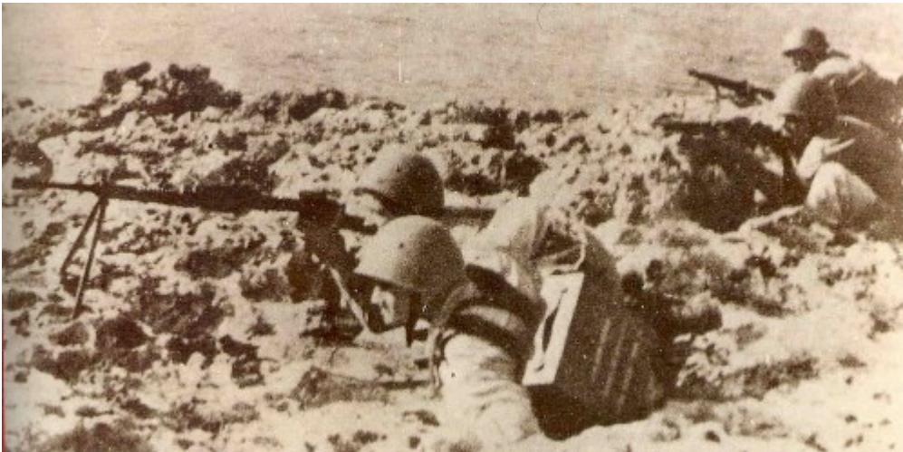
Soldati italiani a Cefalonia (1943)