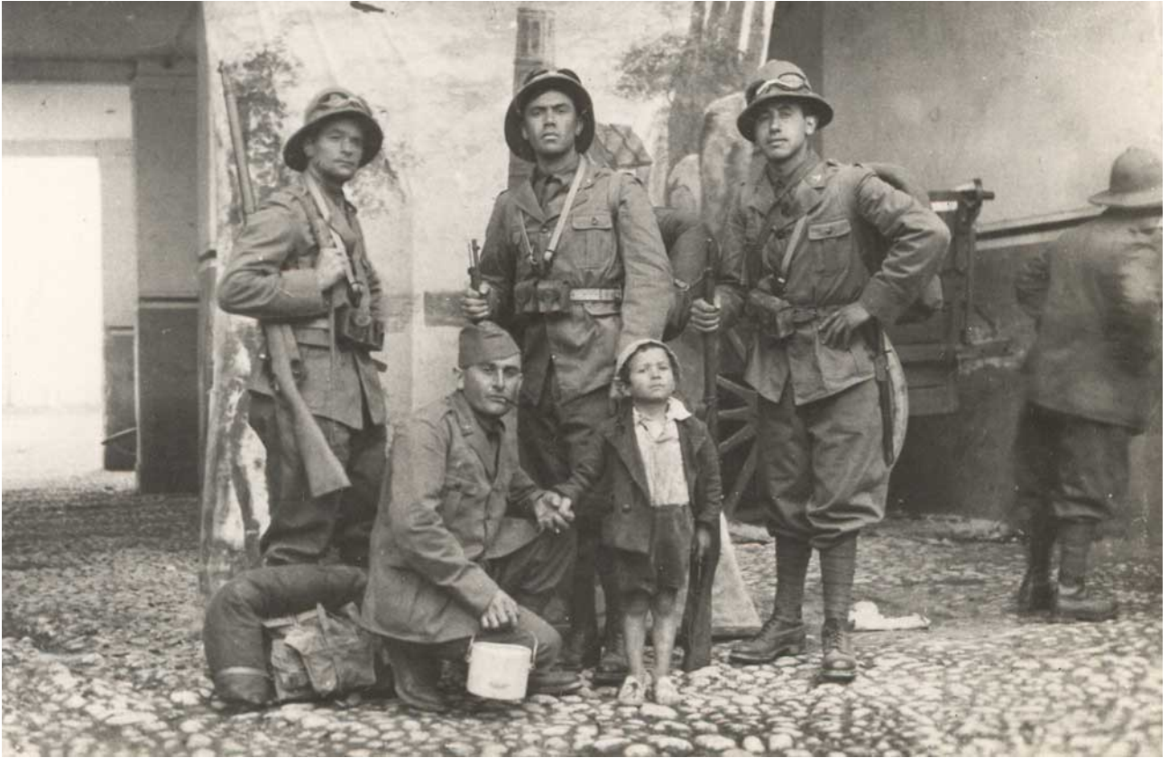
Soldati italiani a Cefalonia (1943)