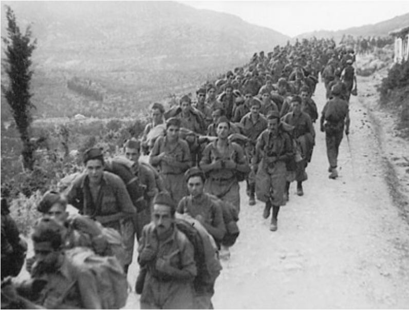
I sopravvissuti a Cefalonia